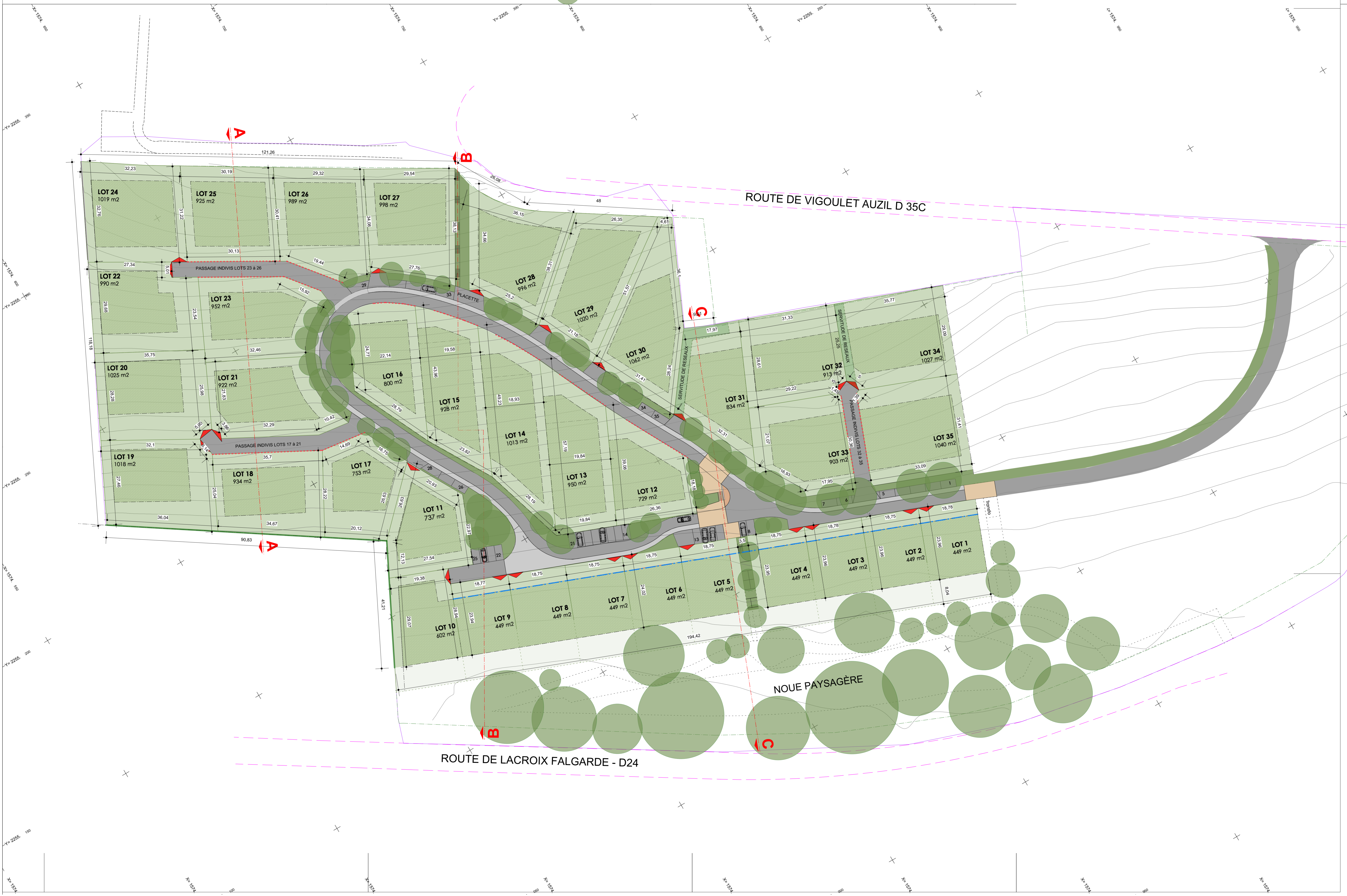
PLAN DE COMPOSITION

ARBRES HAIE EN LIMITE DE LOT ACCES AUX LOTS IMPOSÉS ACCES AUX LOTS POSSIBLES ALIGNEMENT IMPOSÉ